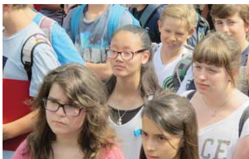
Les élèves écoutent attentivement le message du directeur... c'est bientôt les vacances! MAG