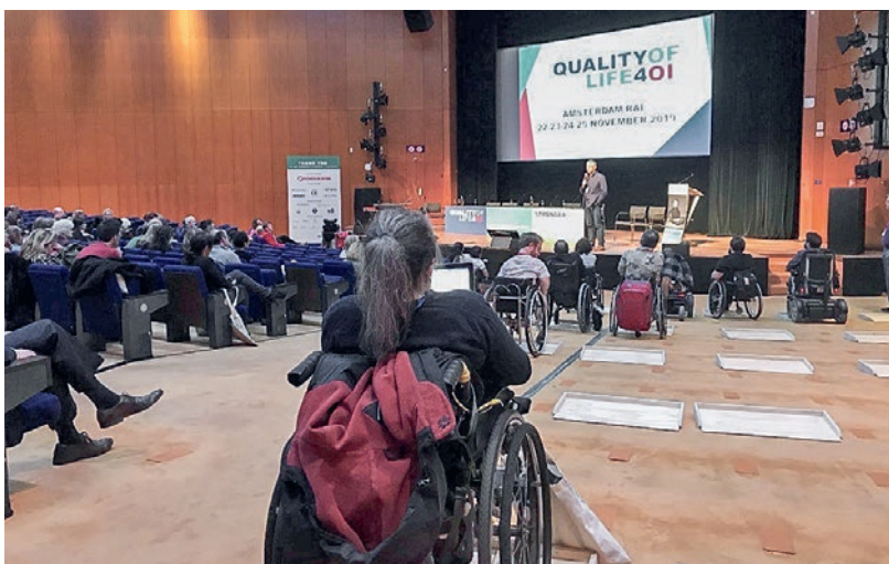
Der Konferenzsaal war mit provisorischen baulichen Massnahmen für Rollstuhlfahrende besonders bequem eingerichtet worden.