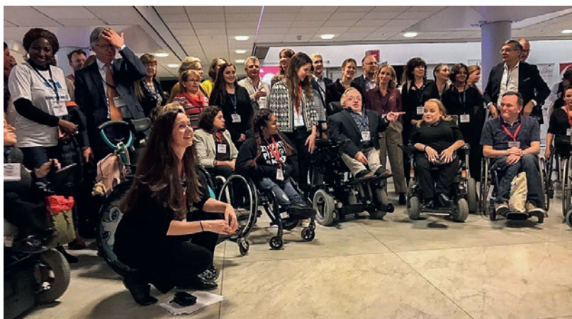
Unter den 300 Teilnehmenden befand sich eine ansehnliche Anzahl Osteogenesis-imperfecta-Betroffene jeglichen Alters und verschiedenster Ausprägungen des Bindegewebe-Defekts.

Weitere Informationen zu Osteogenesis imperfecta finden sich unter www.glasknochen.ch